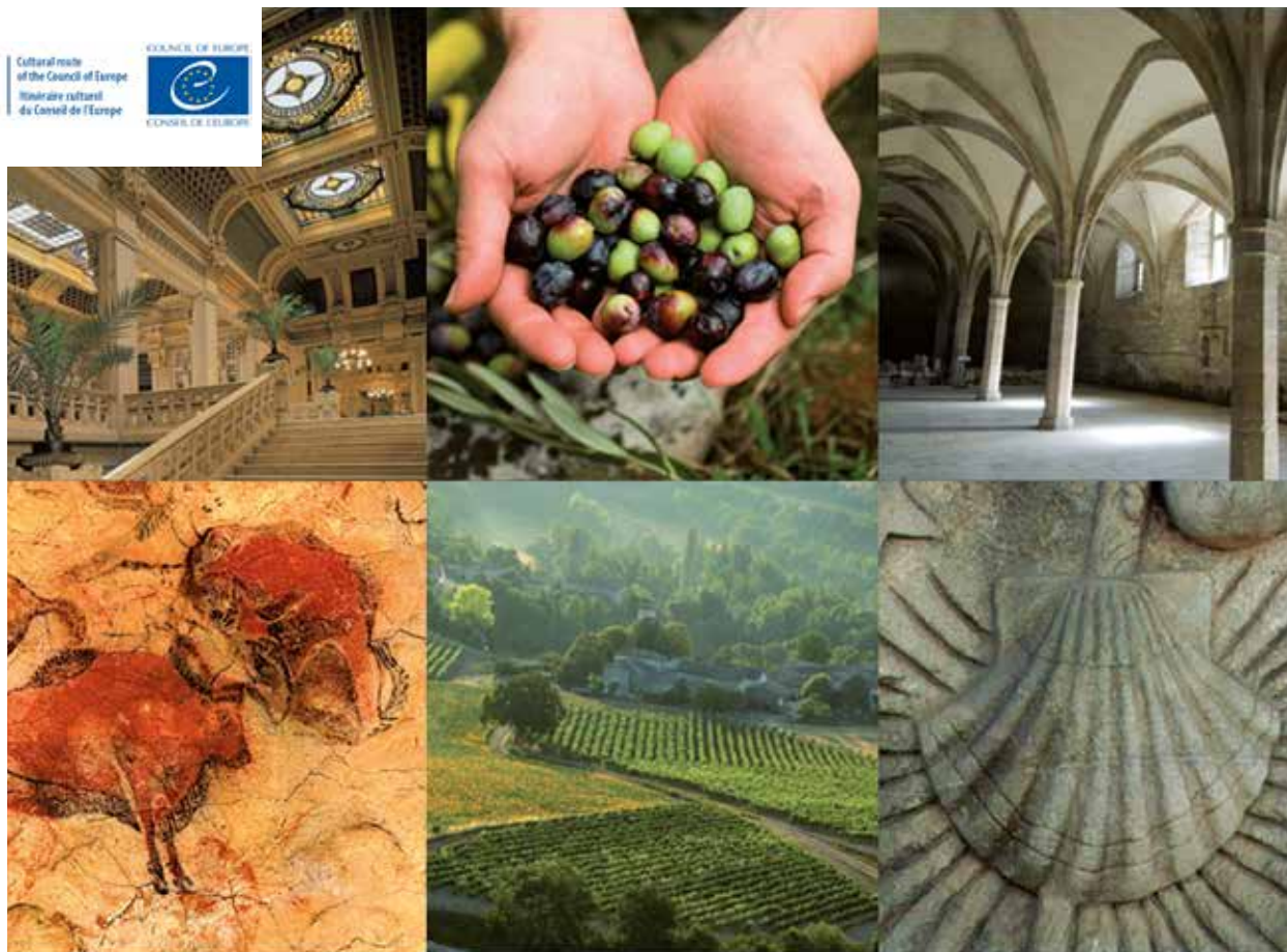
Mitglieder des Europarates