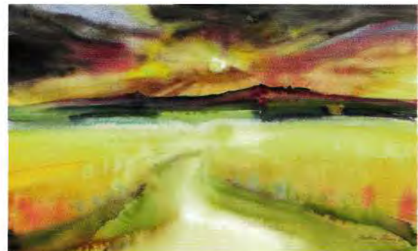
Die „Hohe Straße“ zwischen Königsbrück und Reichenau im Abendlicht