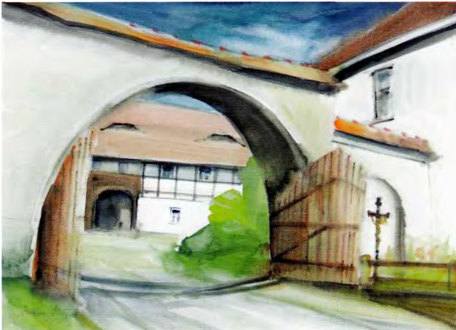
Sorbischer Bauernhof in Crostwitz