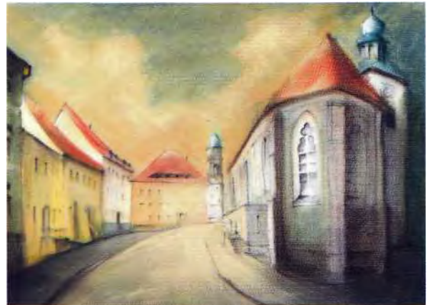
Liebfrauenkirche an der Steinstraße in Bautzen (Pastell)

Prischwitz, Bloaschütz, und wie auch die „obere“ Straße erreichte sie über Seidau die Spreefurt, später Brücke und vermutlich auch die Fernhändlersiedlung von Bautzen. Für diese Variante spricht sich Blaschke in seinen Arbeiten aus, und er erkennt auch in den Ruinen der alten Nikolaikirche die mittelalterliche Kirche der Fernhändlersiedlung. Schrammek hingegen meint mit der Geschichte der Liebfrauenkirche den Händlerstandort in diesem Bereich nachweisen zu können. So bleibt noch Arbeit für die Forschung. Auf dem Wege von Kamenz nach Bautzen werden wir an zwei herausragende Persönlichkeiten des Christentums erinnert: Cyrill und Methodius. Sie hatten im 9. Jahrhundert das Evangelium im Großmährischen Reich, dem Sammelbecken slawischer Stämme nach der keltischen Besiedlung, verkündet. Das Millenniumdenkmal, im Jubiläumsjahr 2000 errichtet, befindet sich auf einer Höhe zwischen Dreikretscham und Schmochtitz.