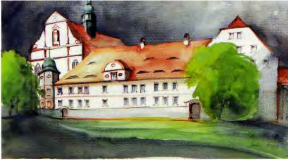
Zisterzienser-Nonnenkloster St. Marienstern