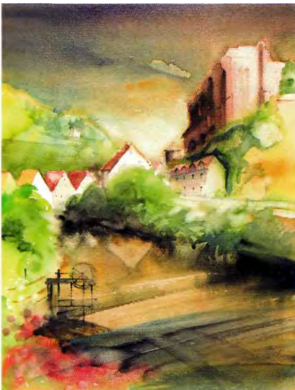
Ruine der Nikolaikirche in Bautzen (Pastell)

Prischwitz, Bloaschütz, und wie auch die „obere“ Straße erreichte sie über Seidau die Spreefurt, später Brücke und vermutlich auch die Fernhändlersiedlung von Bautzen. Für diese Variante spricht sich Blaschke in seinen Arbeiten aus, und er erkennt auch in den Ruinen der alten Nikolaikirche die mittelalterliche Kirche der Fernhändlersiedlung. Schrammek hingegen meint mit der Geschichte der Liebfrauenkirche den Händlerstandort in diesem Bereich nachweisen zu können. So bleibt noch Arbeit für die Forschung. Auf dem Wege von Kamenz nach Bautzen werden wir an zwei herausragende Persönlichkeiten des Christentums erinnert: Cyrill und Methodius. Sie hatten im 9. Jahrhundert das Evangelium im Großmährischen Reich, dem Sammelbecken slawischer Stämme nach der keltischen Besiedlung, verkündet. Das Millenniumdenkmal, im Jubiläumsjahr 2000 errichtet, befindet sich auf einer Höhe zwischen Dreikretscham und Schmochtitz.