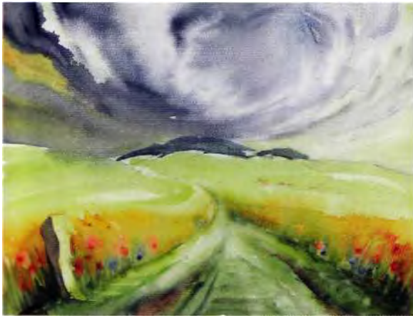
Alte Poststraße am Kamenzener Hutberg