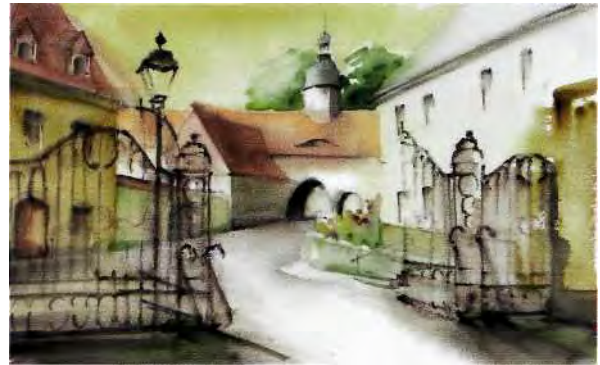
Am Königsbrücker Schloßberg

Wir orientieren uns auf unserer Fahrt gegen Osten und werden sie in Lauban am Queis beenden. Wir haben dann jenes Land durchquert, das 1076 an die Krone Böhmens ging und - mit kurzen Unterbrechungen - bis 1635 als Nebenland dort verblieb.