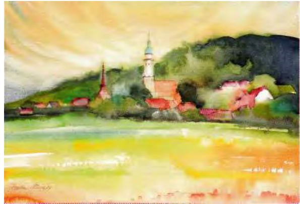
Schönberg/Sulikow an der "antiqua strata" Hinterhofpartie in Lauban/Lubań

Mit der nächsten Etappe überqueren wir die heutige Staatsgrenze von der Bundesrepublik Deutschland in die Republik Polen, aber wir bleiben in der Oberlausitz, die erst am Kwisa/Queis ihre Grenze findet. Am östlichen Stadtrand von Zgorzelec/Görlitz orientieren wir uns erst einmal. Im Süden erkennen wir das Jeschkengebirge und das sich anschließende Isergebirge mit Smrk/Tafelfichte und Wisoka Kopa/Grüne Koppe als den höchsten Erhebungen dieses Granitgebirges. Bis kurz unter den Gipfel des Smrk/der Tafelfichte streckt sich der Südzipfel des einst Oberlausitzer Queiskreises. Im frühen Mittelalter gehörte dieses Gebiet zum Ostausläufer des Zagost. Unser Blick schweift weiter gegen Südost und ahnt in der Ferne die Śnieżka/Schneekoppe, den mit 1602 m höchsten Gipfel des Karkonosze/Riesengebirges. Die südliche Gebirgsbarriere wird an verschiedenen Stellen durchbrochen und verbindet die vom Süden heranführenden Straßen mit der Via Regia