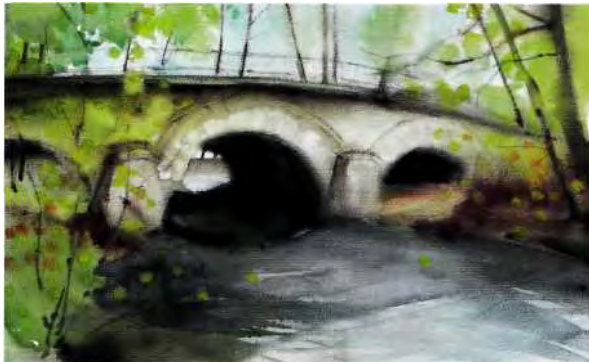
Die Baderbrücke in Königsbrück

Wir orientieren uns auf unserer Fahrt gegen Osten und werden sie in Lauban am Queis beenden. Wir haben dann jenes Land durchquert, das 1076 an die Krone Böhmens ging und - mit kurzen Unterbrechungen - bis 1635 als Nebenland dort verblieb.