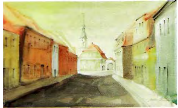
Morgenstimmung in Weißenberg

In diesem Abschnitt des mittelalterlichen Wegeverlaufs ist noch nicht auf die südliche Trasse des Wegekorridders eingegangen worden. Nach Seeliger ist dieser Wegeverlauf in seiner Grundführung mit dem der heutigen Fernverkehrsstraße B 6 vergleichbar. Allerdings nicht so geradlinig, sondern fast schlangenförmig und dabei die Ortschaften Nadelwitz, Baschütz, Kubschütz, Hochkirch südlich tangierend, danach auch Eiserode und Kittlitz. Dieser südliche Zweig der Via Regia überquerte in der Georgewitzer Skala das Löbauer Wasser, setzte seinen Weg fort über Reichenbach, Gersdorf, Jauernick, nahm bei Radmeritz eine der Furten über die Neiße und erreichte über Sulikow/Schönberg die östliche Sechsstadt Luban/Lauban.