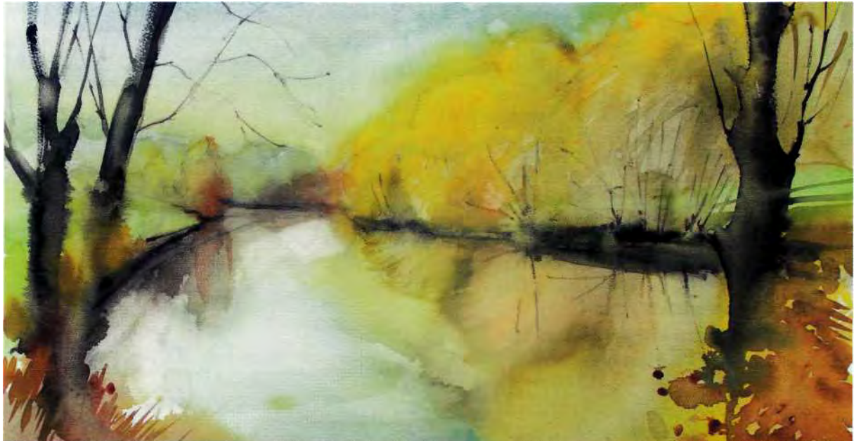
Am alten Grenzfluß Queis bei Lauban/Lubań

Postmeilensäule berichtet. Wiederum ein Beweis, dass die Via Regia ab dem 17./18. Jahrhundert auch die Funktion einer Poststraße übernommen hatte. Wenn wir Lubań/Lauban erreichen, können wir an dem restaurierten Marktplatz eine bereits 2006 restaurierte und wiedererrichtete Postmeilensäule bewundern. Über den Fluß Kwisa/Queis verabschiedet sich seit altersher die Hohe Straße von der Oberlausitz; ein nördlicher Weg über Godziesów/Günthersdorf wechselte bei Nowogrodziec/Naumburg. Im etwa 60 km östlicher gelegenen Legnica/Liegnitz erinnert die Schlacht bei Wahlstatt im Jahre 1241 an den „Zorn der Tartaren“, jene mittelalterlichen Katastrophe, die nicht vergessen lässt, dass Handelswege keineswegs nur friedliche Funktionen erfüllten.