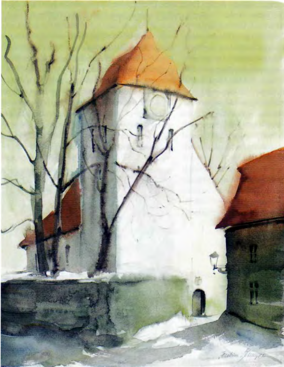
Die Kirche des Ackerbürgerstädtchens Reichenbach im Winterkleid