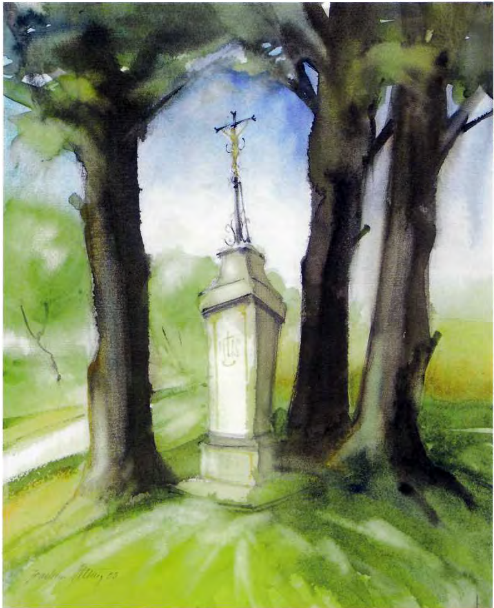
Wegekreuz in Storchau