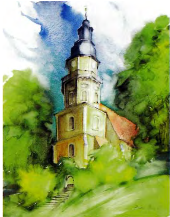
Die Hauptkirche in Königsbrück Am Kamenzener Burglehen

Kein Wunder also, wenn wir für dieses Teilstück der Via Regia auch dem Namen „Via regia Lusatiae“ begegnen. Über die bekannte „Baderbrücke“ führte die „Frankenstraße“ in die Stadt Königsbrück, wo sie sich mit der Via Regia kreuzte. Wir verlassen Königsbrück in östlicher Richtung und erreichen über Reichenau und Schwosdorf Kamenz, sorbisch Kamjene = Ort am Stein. In den Forschungsarbeiten von Herzog wird noch auf eine weitere mittelalterliche Verbindung hingewiesen, die wohl nach Koitzsch und dann weiter über Neukirch nach Kamenz führte. Interessanter dürfte aber die erstgenannte Route sein, bietet sie uns doch kurz vor Reichenau, parallel zur Dorfeinfahrt, einige Kilometer „Hohe Straße“, und im Wald vor Schwosdorf sind Hohlwege der alten Via Regia zu bestaunen. In der Lessingstadt Kamenz steht eine aussagefähige Museumslandschaft bereit, unser Wissen zu vervollkommen.