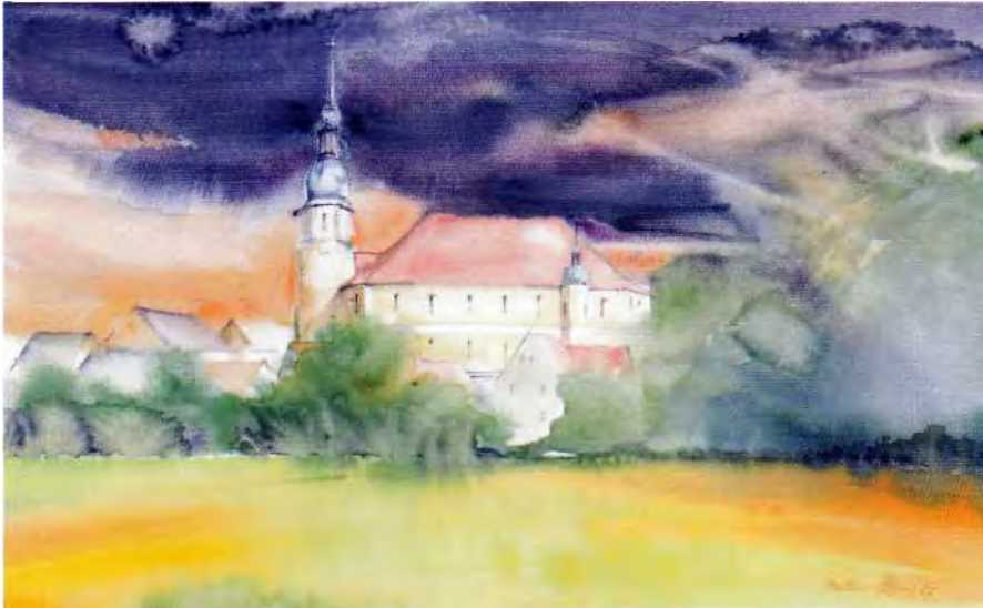
Gewitter über dem ländlichen Zentrum Crostwitz