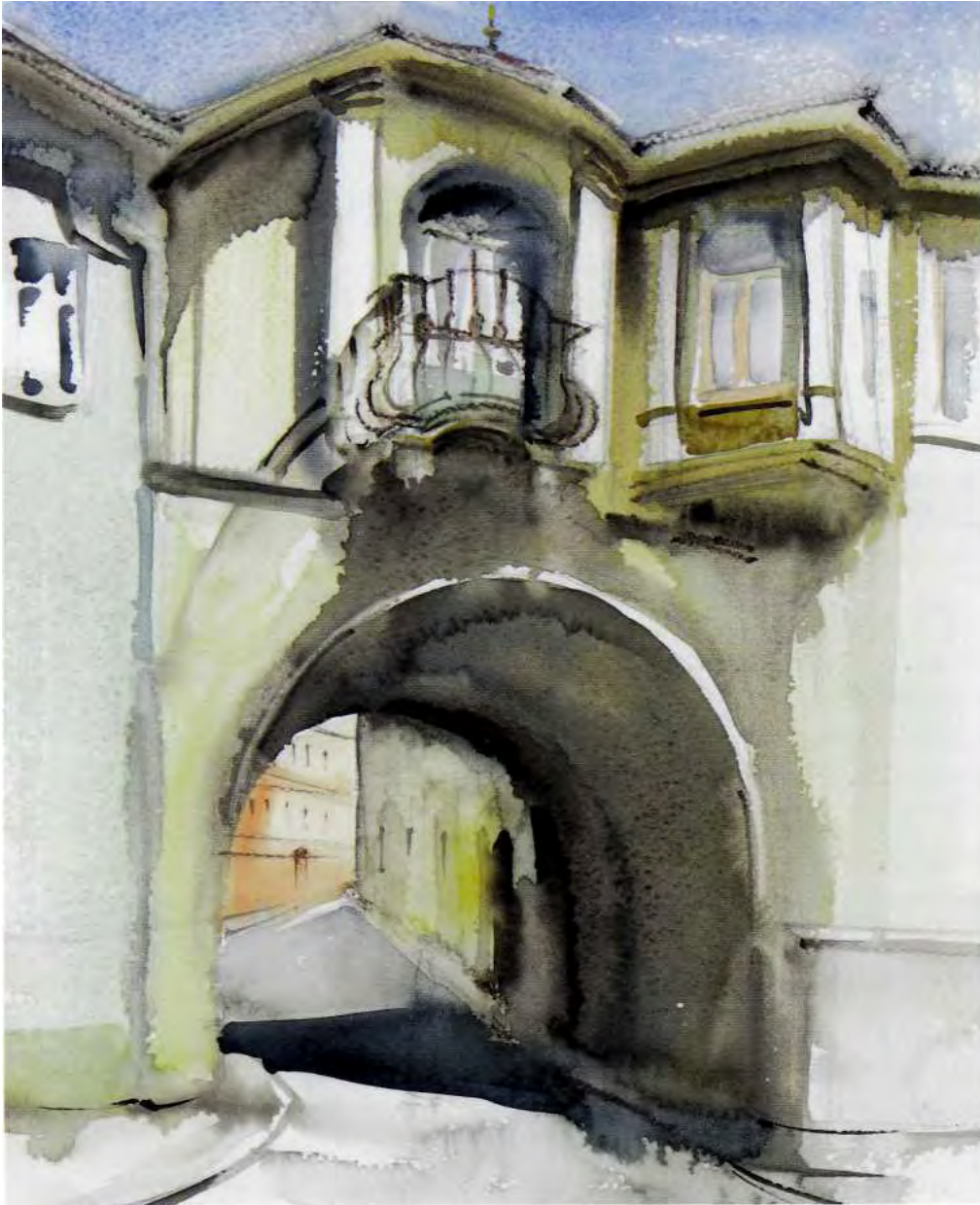
Torbogen in der Klosterstraße in Kamenz