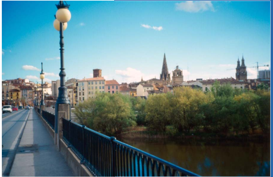
06.04.2002: Ankunft in Logroño