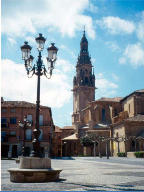
08.04.2002: in Santo Domingo de la Calzada