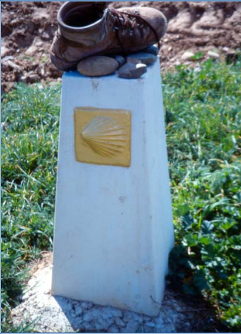
08.04.2002: Wegzeichen nach Santo Domingo de la Calzada