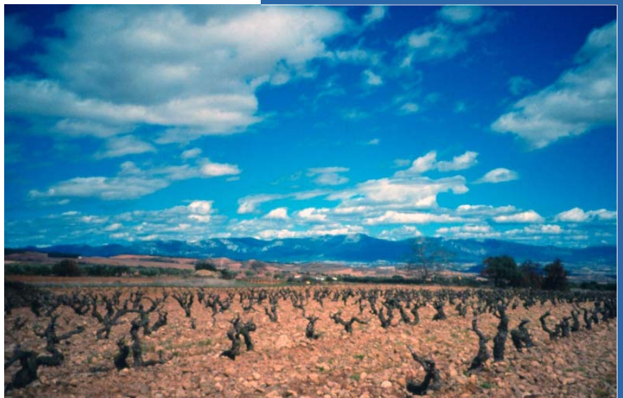
07.04.2002: Weinanbau im westlichen Navarrete