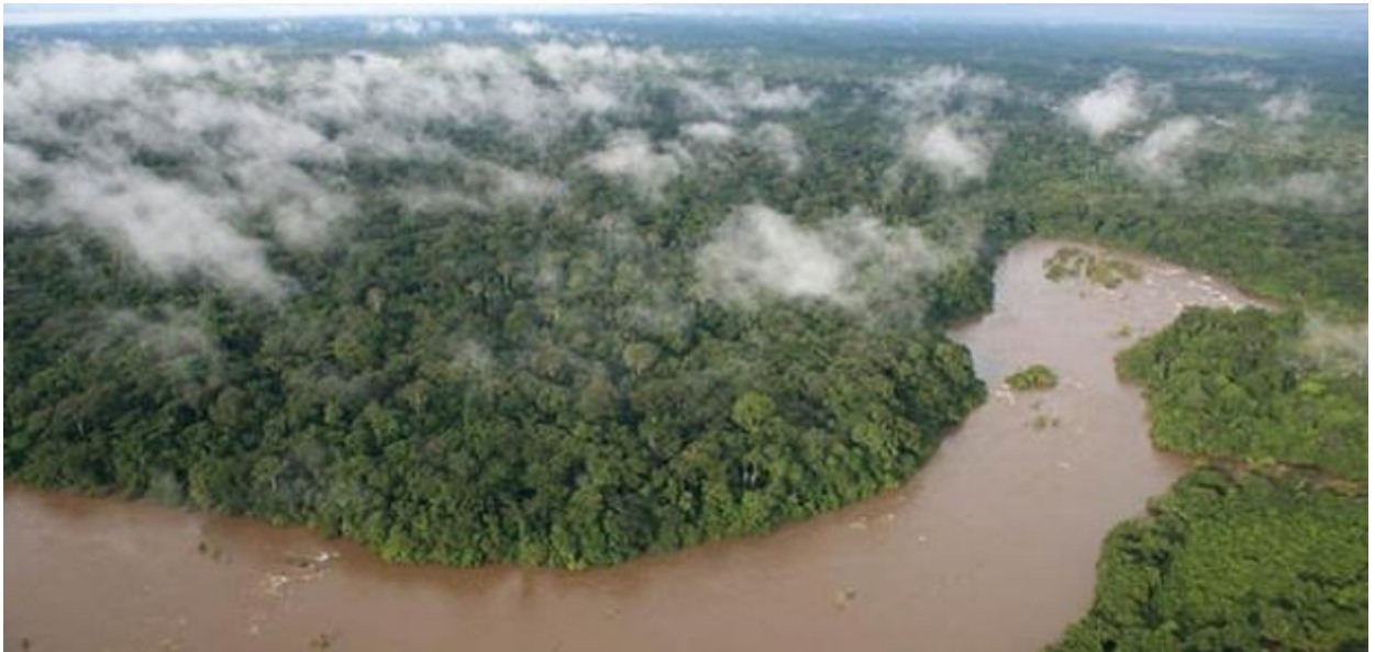
Ліс Гола на кордоні Сьєра Леоне та Ліберії

П артнерство BirdLife уже давно визнало, що робота з охорони птахів чинить позитивний вплив на інше біорізноманіття, а також на громади, котрі залежать від природних ресурсів і екосистемних послуг, наданих територіями, важливими для птахів (IBA територіями).