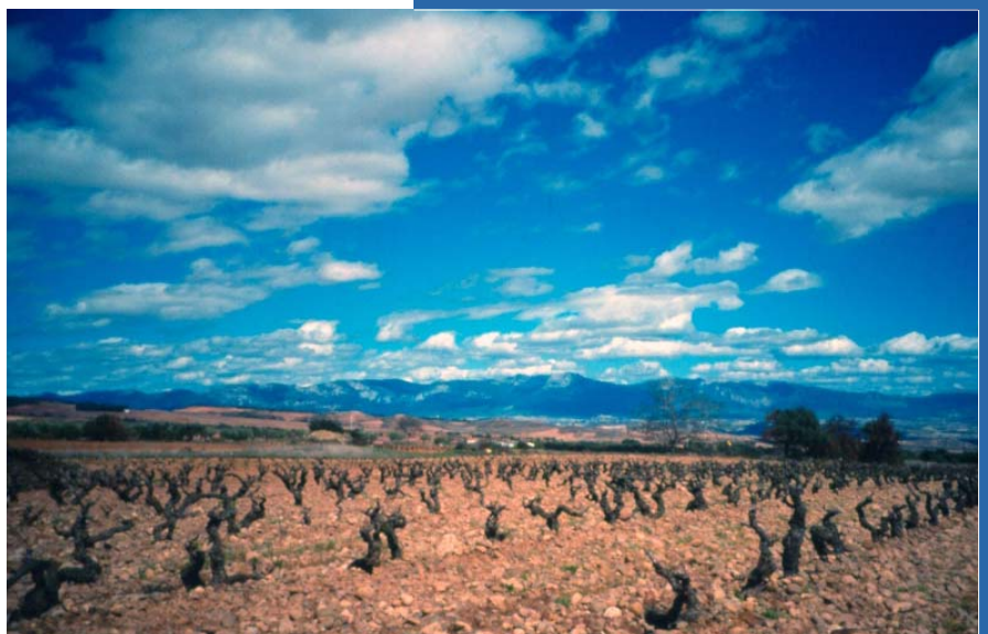
07.04.2002: Weinanbau im westlichen Navarrete