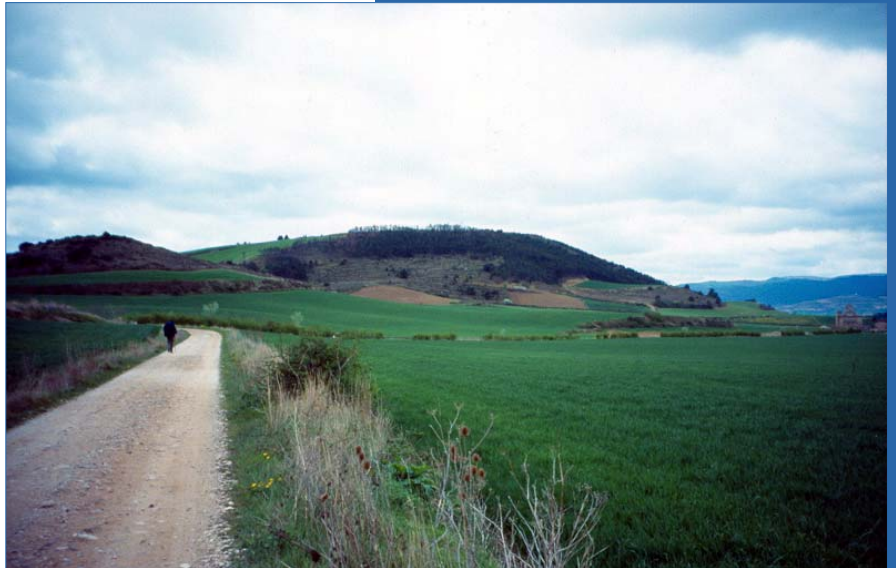
04.04.2002: Auf dem Weg zwischen Monreal und Santa María de Eunate