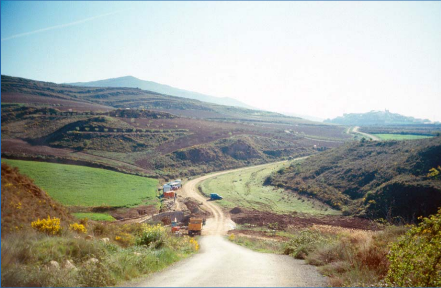
05.04.2002: in Richtung Estella