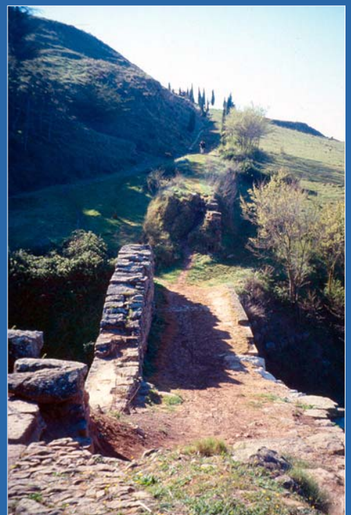
05.04.2002: nach Cirauqui auf historischem Jakobsweg