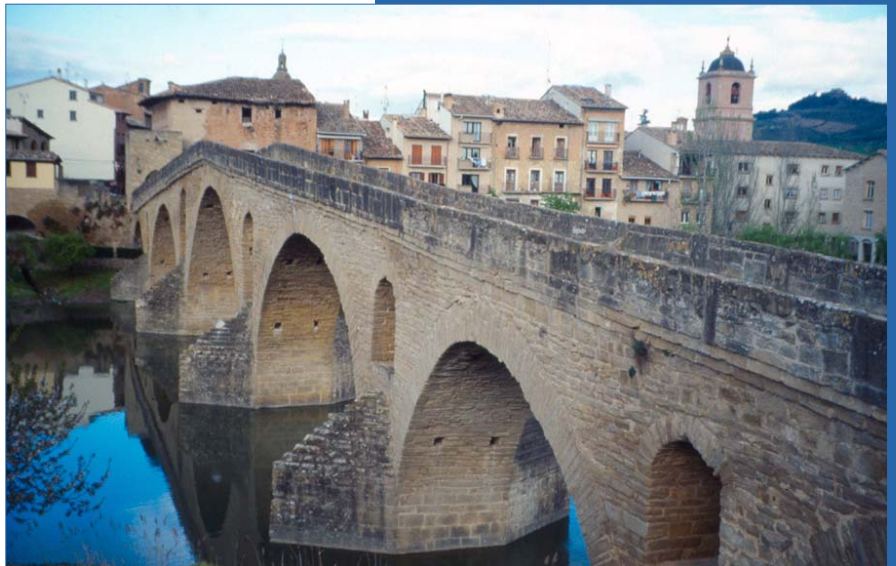
04.04.2002: Puente la Reina - Brücke der Königin (11. Jahrhundert, Romanik)