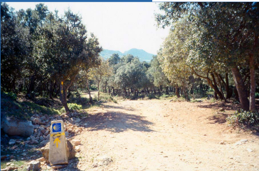
05.04.2002: Jakobsweg westlich von Estella